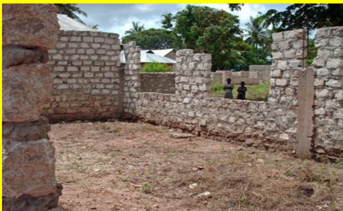
links: Die VIPI NGO Dorfschule: Hier wollen wir von den Spendengeldern baldmögl. das Klassenzimmer für eine weitere Schulklasse fertig bauen. Die Mögl., die Dorfschule zu besuchen, ist für die Kinder & Jugendl. die einzige Chance für eine Zukunft in Würde.

Wir/Sie unterstützen beim Kauf dieser Allzweck-Schalen das Heimatdorf unseres afrikanischen Mitarbeiters Alibaba Mwambaya aus Kenia. Das Dorf liegt ca. 10km nördlich von Mombasa. Dort gibt es momentan weder einen Wasserbrunnen noch Strom. Auch soll das Klassenzimmer (Foto unten) für die Schulkinder mit den EDEKA-Spendengeldern balmöglichst weiter-/fertig gebaut werden. Pro verkaufte Müsli-Schale in unseren EDEKA-Märkten kommen von den 1,99 € Verkaufspreis >> 60 Cent << dem Dorf VIPI NGO & somit direkt den Kindern dort zugute !!! Dafür an dieser Stelle an alle EDEKA-Kollegen/innen und Vereinsmitglieder von VIPI NGO e.V. sowie an Sie - sehr geehrte EDEKA Kunden - ein herzliches DANKESCHÖN!